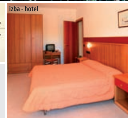
izba - hotel

športy. V blízkosti je Aqualandia, široká ponuka výletov: plavba pirátskou loďou, návšteva Benátok, reštaurácií, kaviarní, barov a diskotiek v letovisku a okolí. Oficiálna kategória hotela: ***