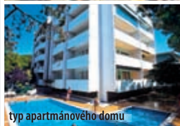
typ apartmánového domu