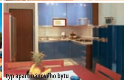
typ apartmánového bytu