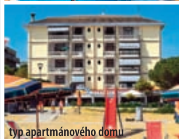
typ apartmánového domu