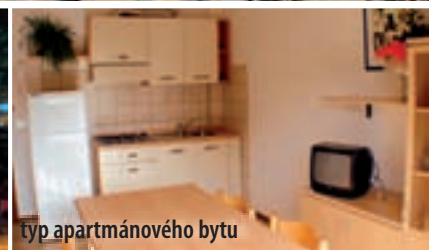
typ apartmánového bytu